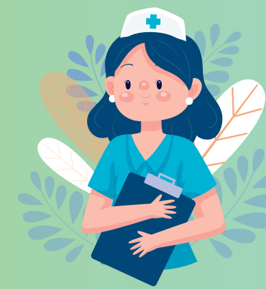
Infirmière déléguée en Santé Publique (Asalée)